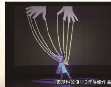
表現科公演・3年映像作品