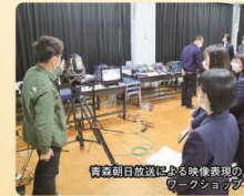
青森朝日放送による映像表現のワークショップ