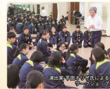
演出家・平田オリ氏によるワークショップ