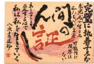
第15回書道パフォーマンス甲子園予選 出品作品