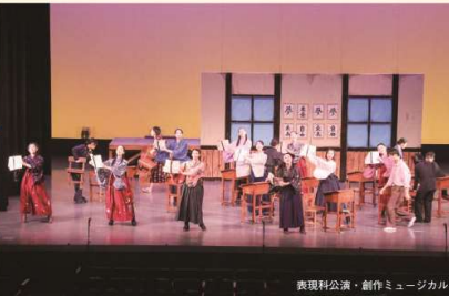
表現科公演・創作ミュージカル