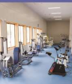
トレーニングルーム(平成23年3月完成)