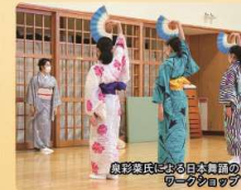
旗彩家氏による日本舞踊のワークショップ