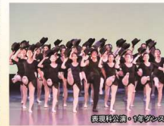
表現科公演・1年ダンス