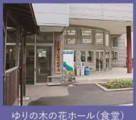
ゆりの木の花ホール(食堂)