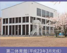
第二体育館(平成23年3月完成)