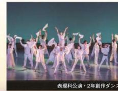
表現科公演・2年創作ダンス